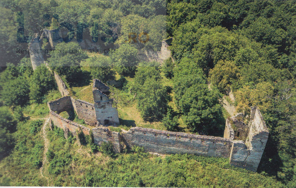
Ruinele cetății Saschiz, vedere aeriană

falnicele biserici pe care comunitățile credincioșilor de odinioară au reușit să le ridice.