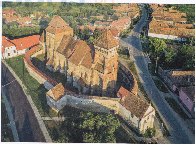
Biserica evangelică fortificată din Valea Viilor, vedere aeriană

și obiectele cu valoare artistică și istorică (altare poliptice, piese de mobilier, inventar liturgic etc.) adăpostite înăuntru.