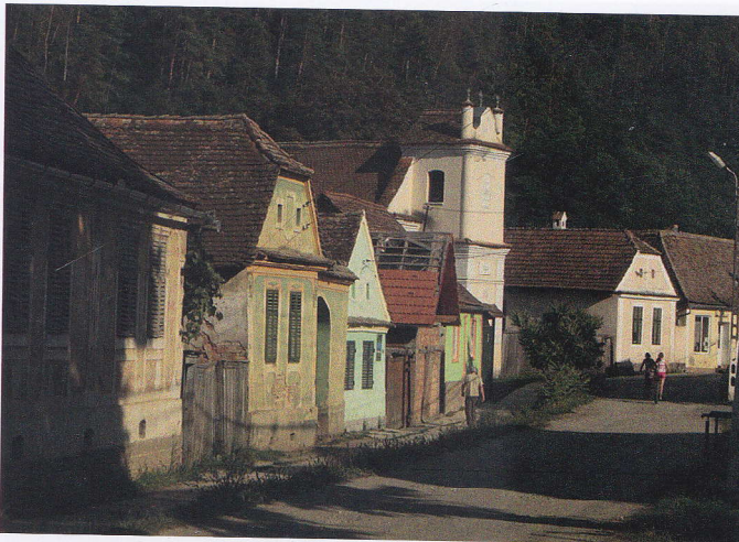
Case în Mălâncrav

Regiunea situată între orașele Sighișoara și Mediaș și desfășurată de o parte și de alta a bazinului mijlociu al râului Târnava Mare este o zonă în care abundă bisericile medievale - fie ele fortificate sau nu, fie ele edificii impunătoare sau mai modeste. Nu ar fi o exagerare dacă s-ar afirma că aproape fiecare localitate veche din această zonă păstrează - fie integral, fie în parte - edificii de cult din perioada medievală.